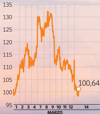
Evolución del barril 'Brent' en 15 días ($)